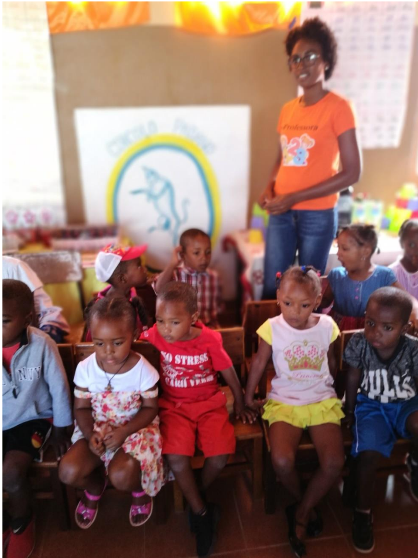
La scuola di Morrinho