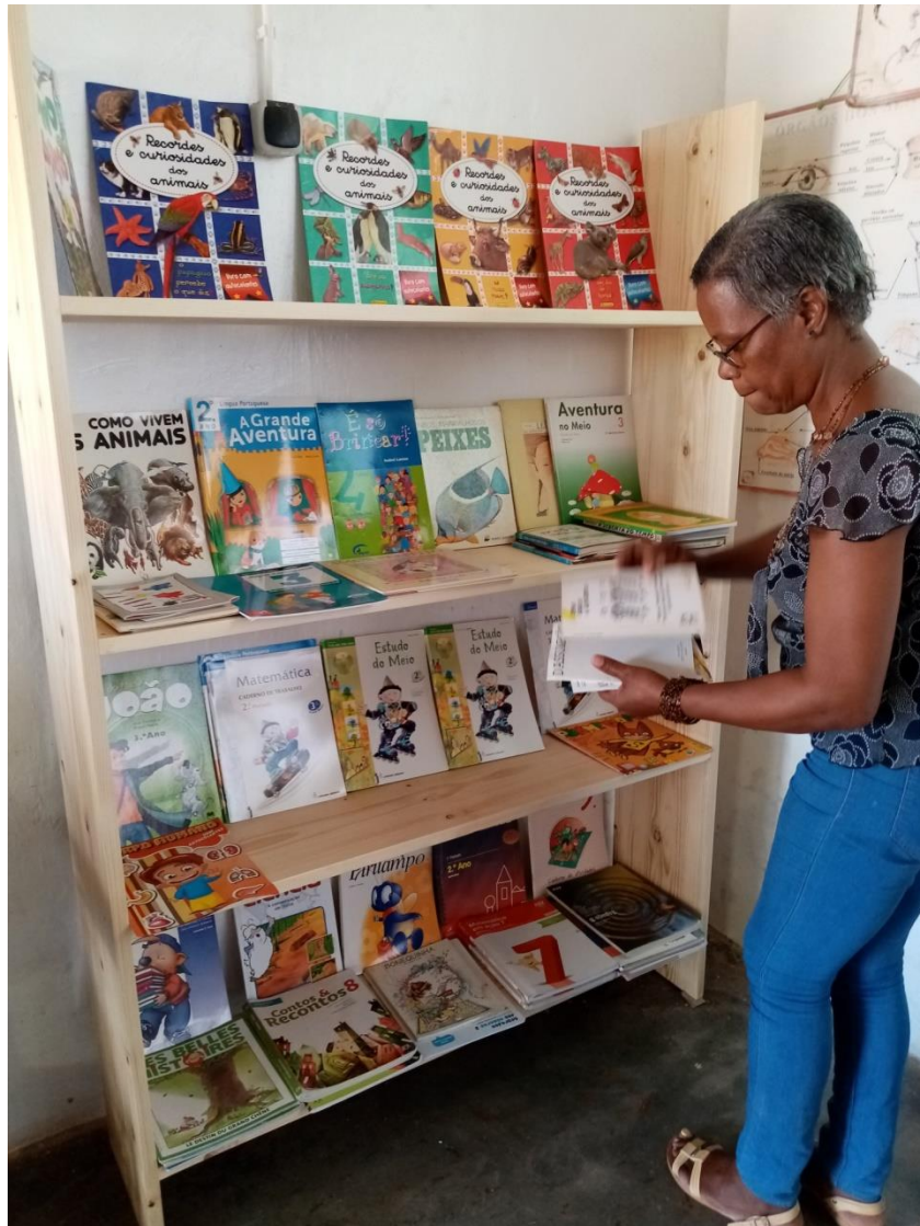
Lo scaffale di legno con i libri