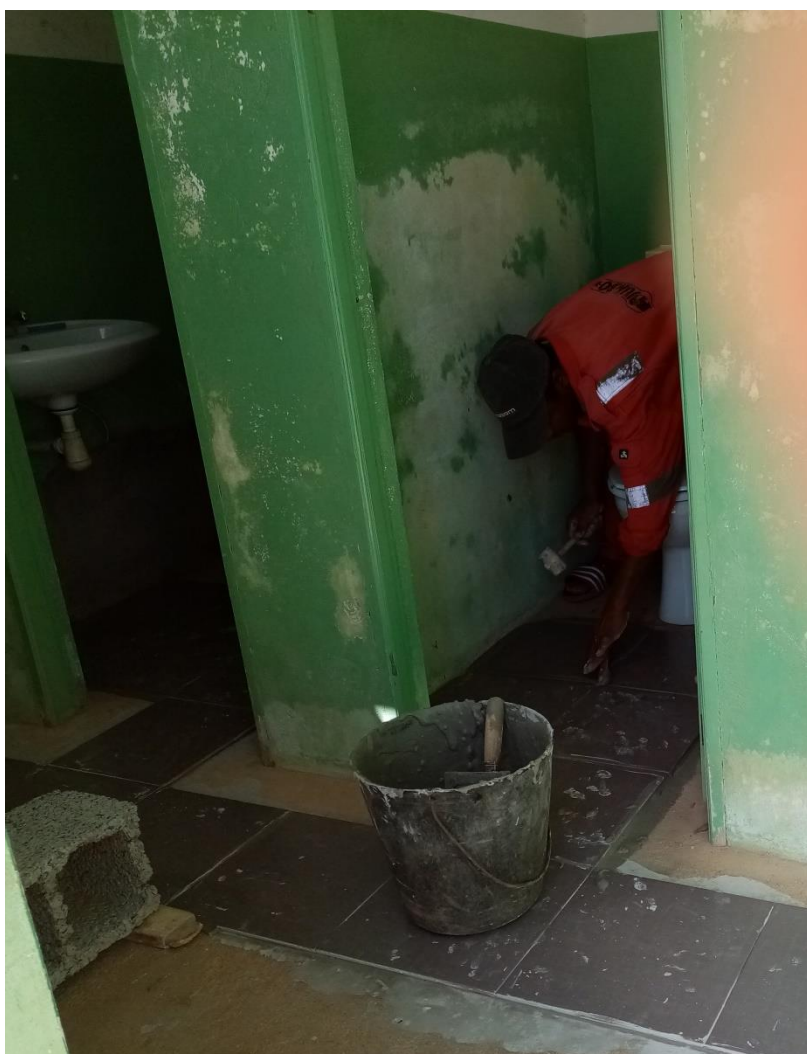
Servizi igienici in rifacimento