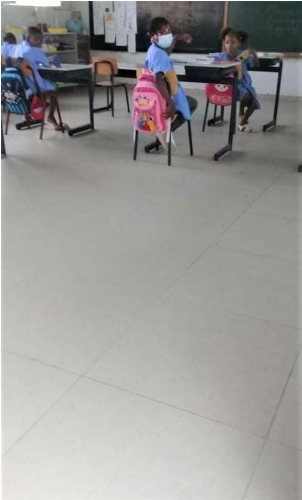
Ottobre 2020, fine dei lavori: il pavimento nuovo in piastrelle di gres ceramico.