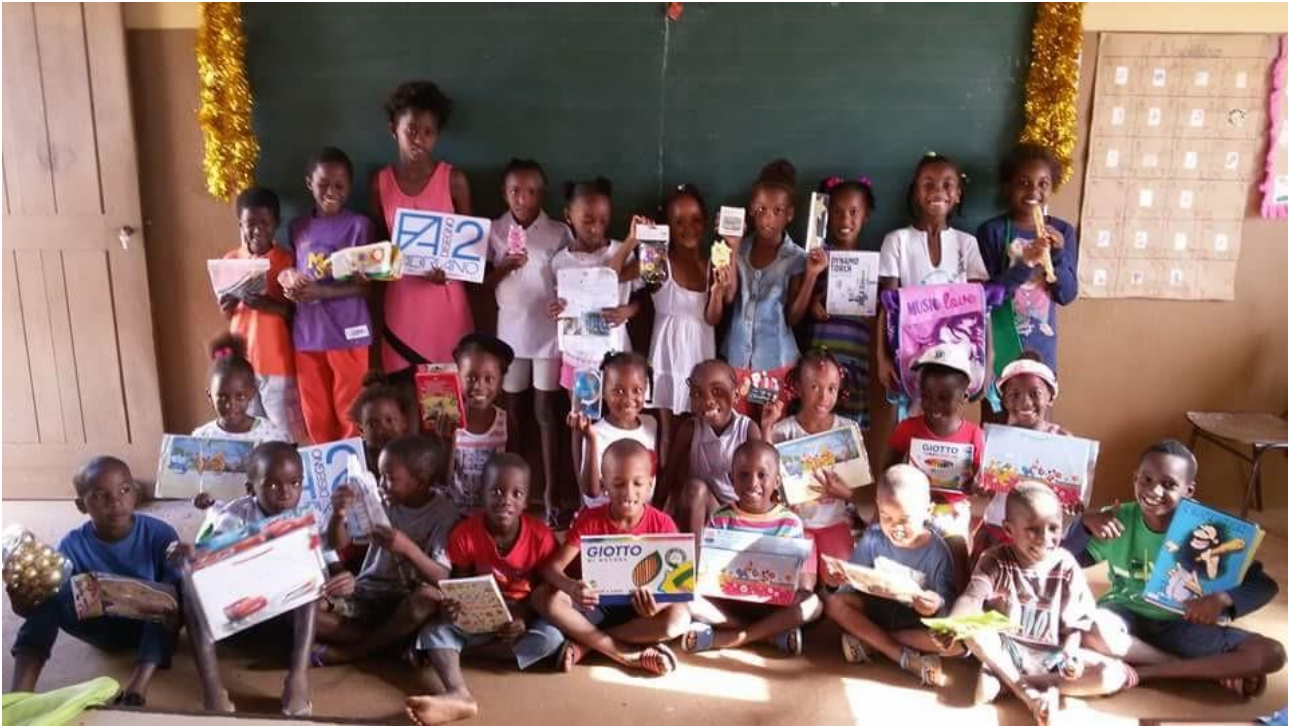
I bambini con il materiale didattico