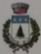
Comune di Pino Torinese