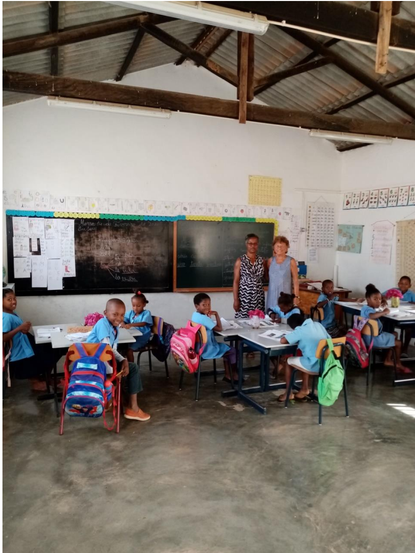
Dicembre 2019 : il vecchio pavimento in cemento dell'aula di Morro.