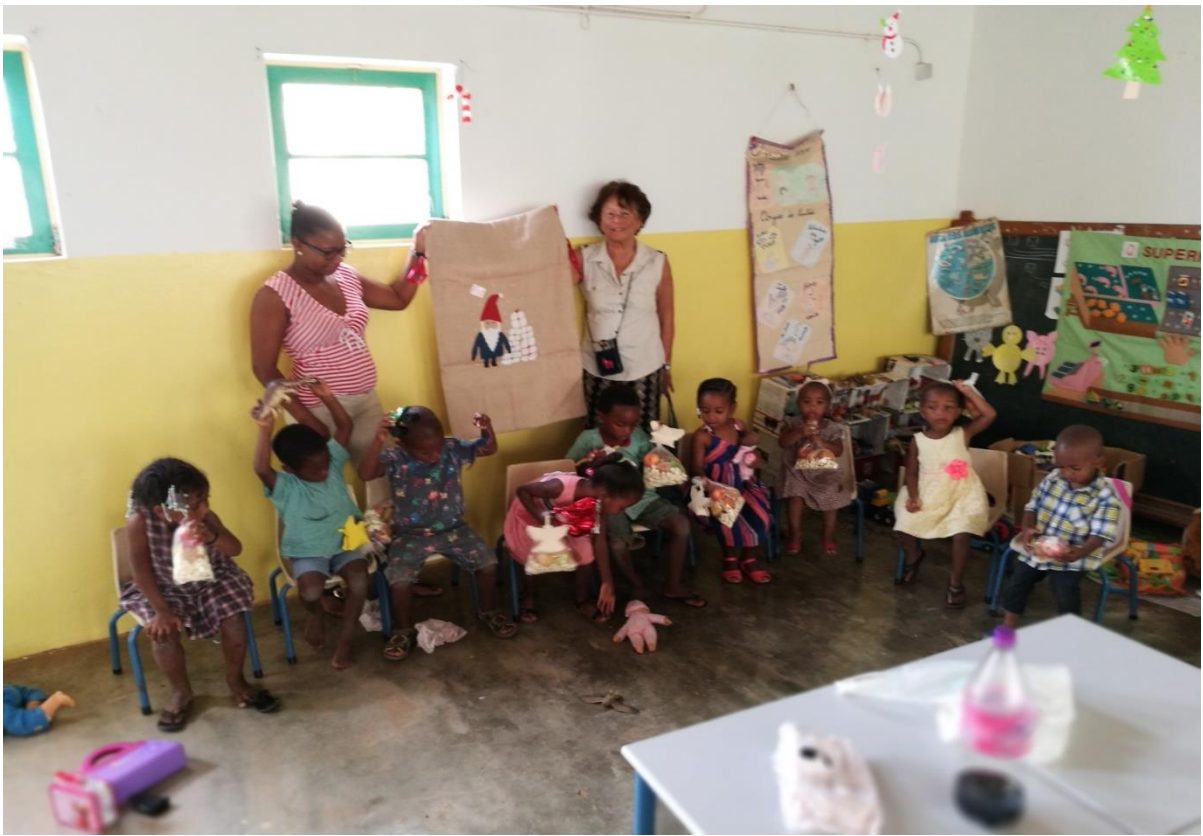
Scuola di Cascabulho

Natale 2019, ogni bimbo ha ricevuto un regalo.